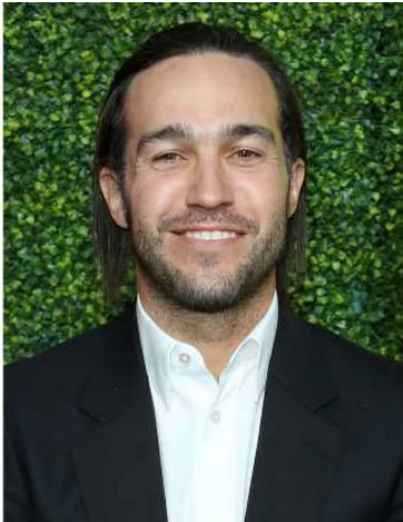
Chris Pratt (2002, 2018)

Conhecido por ser o baixista da banda de rock Fall Out Boy, desde 2001, Wentz lançou diversos álbuns, tais como, "Save Rock and Roll" (2013), "American Beauty/American Psycho" (2015) e "Mania" (2018). Ele também atuou em filmes e seriados como "Winter Tales" (2007), "Teen Titans Go!" (2017) e "School of Rock" (2016-18).