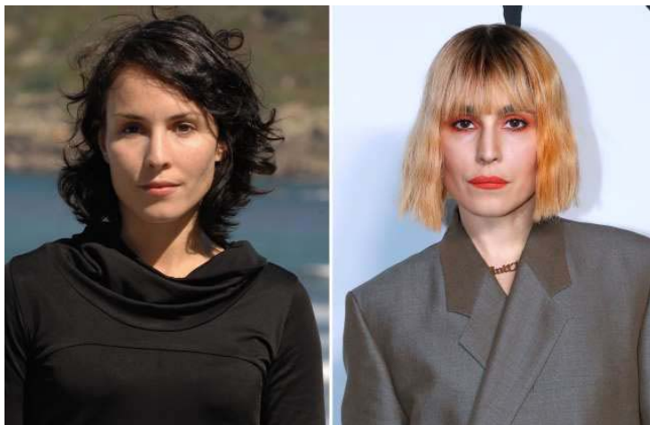
Noomi Rapace (2007, 2019)

Noomi Rapace ganhou fama internacional graças à série de filmes "Låt den rätte komma in" (2008-12) e ao filme "Aquaman" (2018). Ela também trabalhou com o seriado "Baywatch" (2017). Outros trabalhos dele foram em "North Shore" (2004), "Atlantis" (2005-09), "Road to Palmyra" (2009), "Superman: A Origem da Justiça" (2013) e "Frontier" (2016-18).