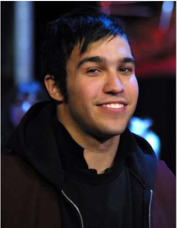
Pete Wentz (2004, 2018)

Celebridades que irão fazer 40 anos: Antes e depois