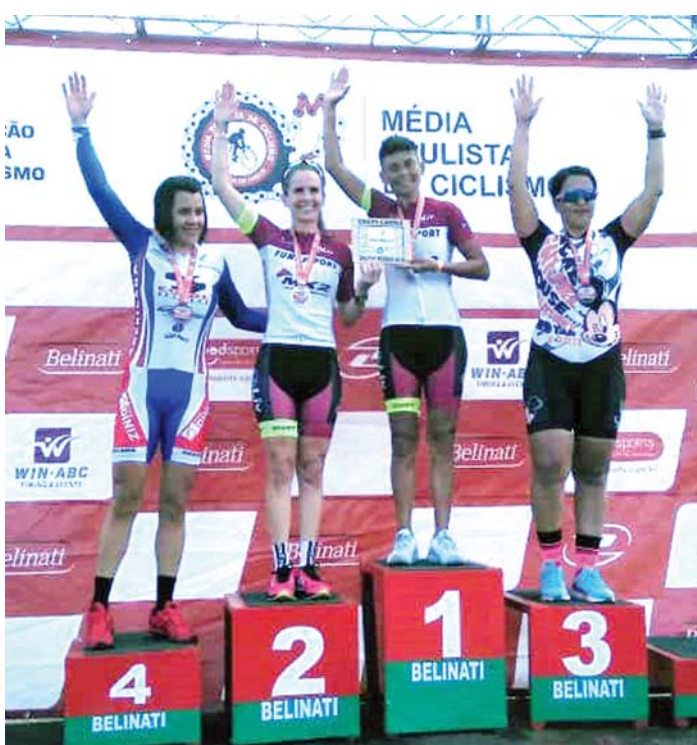
Equipe de ciclismo de Araraquara

A exemplo de 2018, quando apresentou um bom desempenho ao longo do ano, a equipe de ciclismo da Fundesport começa a temporada 2019 conquistando títulos.