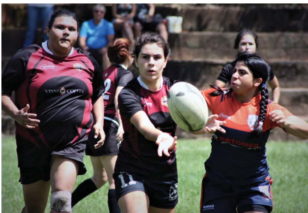
Locomotiva Rúgbi luta para manter na liderança no Circuito Rúgbi

LOCOMOTIVA LIDERA COMPETIÇÃO E CONTA COM APOIO DA TORCIDA LOCAL