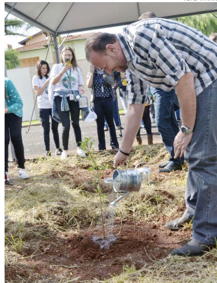
Prefeitura, Daae e Grupo Heineken realizam plantio de mudas de árvores no Parque Tropical

Recentemente, o Grupo Heineken anunciou investimento de R$ 250 milhões na unidade de Araraquara para obras de modernização do processo de produção da unidade da cervejaria e para a estrutura da estação de tratamento de despejos industriais. Com isso, serão gerados 270 novos empregos na fábrica.