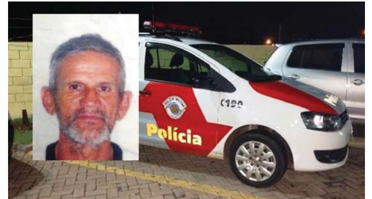
Homem é agredido depois de esfaquear ex-mulher

Uma mulher de 51 anos foi atacada por seu ex-marido com diversas facadas. A tentativa de feminicídio ocorreu na noite de sábado (18) em Santa Lúcia.